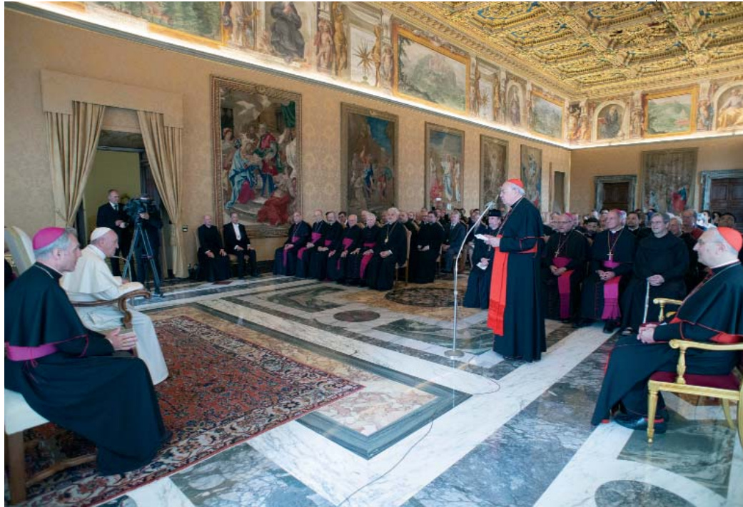
Der Papst empfing die Teilnehmer der ROACO, die von Kardinal Leonardo Sandri, dem Präfekten der Kongregation für die orientalischen Kirchen geleitet wurde.

den Wurzeln kommt und unserer Seele im Westen Leben schenkt, indem sie den Weg der Kontemplation und der Heiligkeit lehren“, fasste der Nachfolger Petri zusammen. Er äußerte auch den Wunsch, dass vor allem der Hoffnung großer Wert verliehen wird, die als ein Ideal im Nahen Osten, dem „Land Jesu“ gepflegt werden muss.