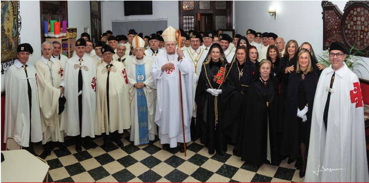
Der Großmeister des Ordens und der Generalgouverneur haben die 130 Jahre der Statthalterei für Argentinien bei einer historischen Begegnung in Buenos Aires gefeiert, wo auch die Investituren der neuen Mitglieder vorgenommen wurden.