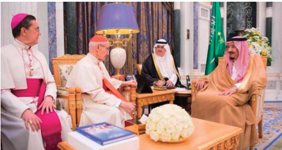
Treffen von Kardinal Jean-Louis Tauran mit König Salman von Saudi-Arabien im April dieses Jahres in Riyad.