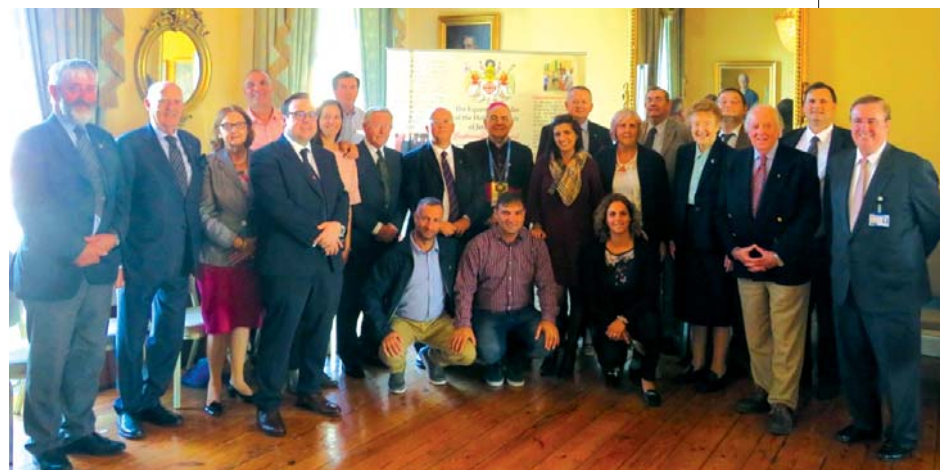
Der Patriarchalvikar für Jerusalem und einige Mitglieder der irländischen Statthalterei des Ordens mit zwei Ehepaaren, die speziell aus dem Heiligen Land gekommen waren, um am Weltfamilientreffen in Dublin teilzunehmen.

Die Mitglieder der Statthalterei des Ordens vom Heiligen Grab für Irland beteiligten sich aktiv am 9. Weltfamilientag, der Ende August 2018 in Dublin zum Besuch von Papst Franziskus organisiert wurde, der um Verzeihung für den Skandal des Missbrauchs an Minderjährigen durch Mitglieder der Kirche in diesem Land