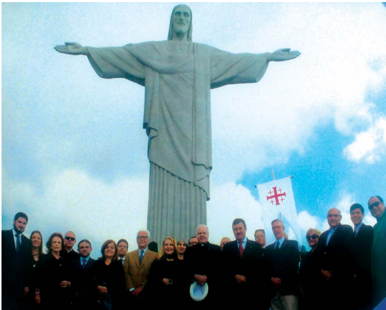
Kardinal O'Brien und der Generalgouverneur vor der Statue, Christus der Erlöser' in Rio, in Begleitung der lokalen Verantwortlichen des Ordens.